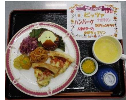
ハロウィンプレート