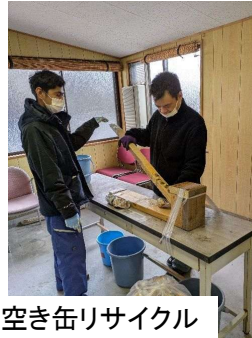
空き缶リサイクル