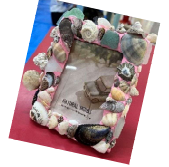
ゆめタウンイベント(リース、フォトフレーム作り体験)