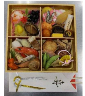
元旦のおせちは、法人の全事業所が協力して作ります